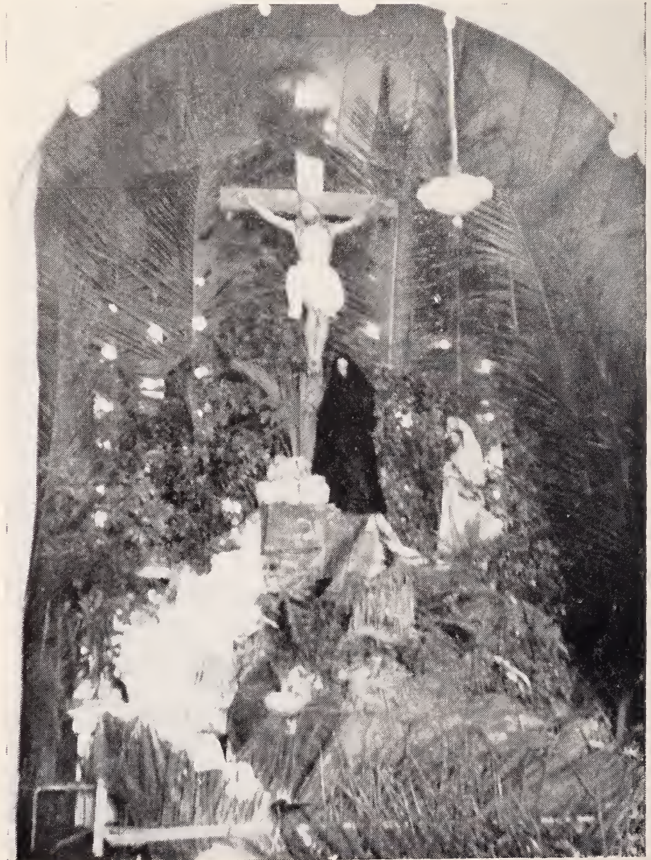
“El Calvario” o monumento doloroso, instalado en el presbiterio del Templo Parroquial de Sinamaica, el día de Viernes Santo y que tan hondas emociones causó en la numerosa concurrencia.